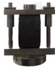
圧裂試験供試体載荷板 ※ご使用中のマーシャルヘッド は継続使用出来ます。