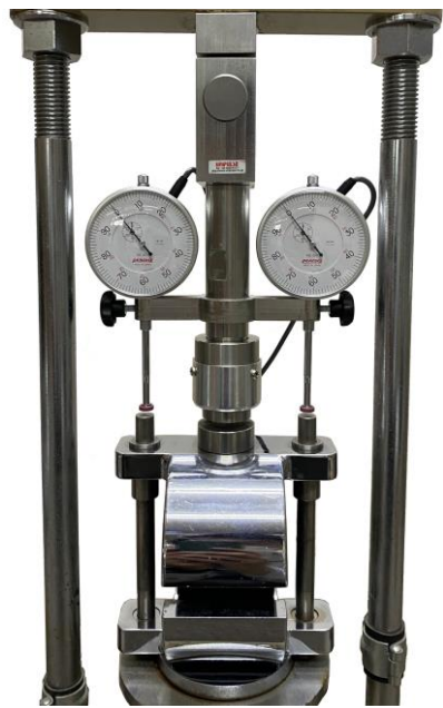
マーシャル試験機 歪みゲージ式ロードセル(50kN)/ 歪みゲージ式変位計(ダイヤルゲージ) 取付部品(ホルダ・ロット等) 計測用パソコン